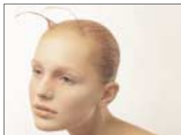
de masterclass Gruppo Select: geraffineerd gebruik van kleuren en materialen