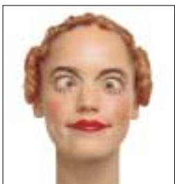
een totale metamorfose door een uitbundige make-up