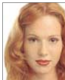
make-up: het leren lezen van een gezicht