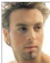
een geraffineerde make-up waarbij het stoere karakter wordt behouden