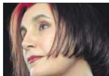
delicaat materiaalgebruik benadrukt de kracht van de leeftijd