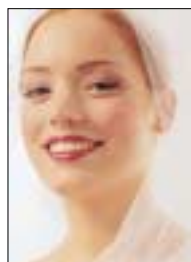
een vlinderlichte make-up geeft de bruid een prachtige naturel look