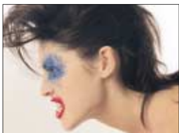
oogstrelende spanning door een explosie van kleuren voor ogen, wangen en lippen