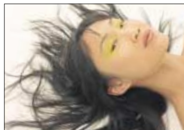
minimalisme en verfijnde technieken voor een Aziatische schoonheid