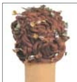
kapsel en styling maken het plaatje compleet