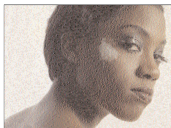
de donkere huid met verschillende kleurschakeringen; een aparte make-up op verschillende plaatsen van het gezicht